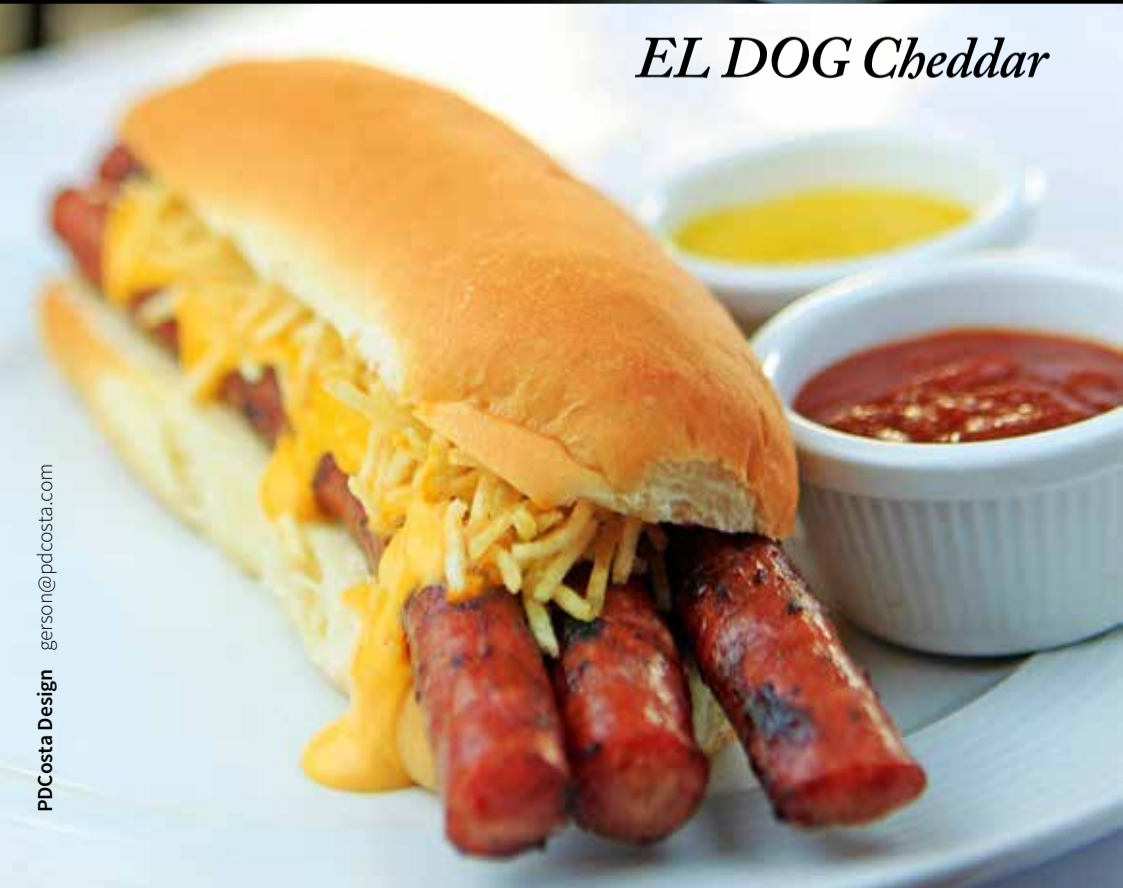
EL DOG Cheddar