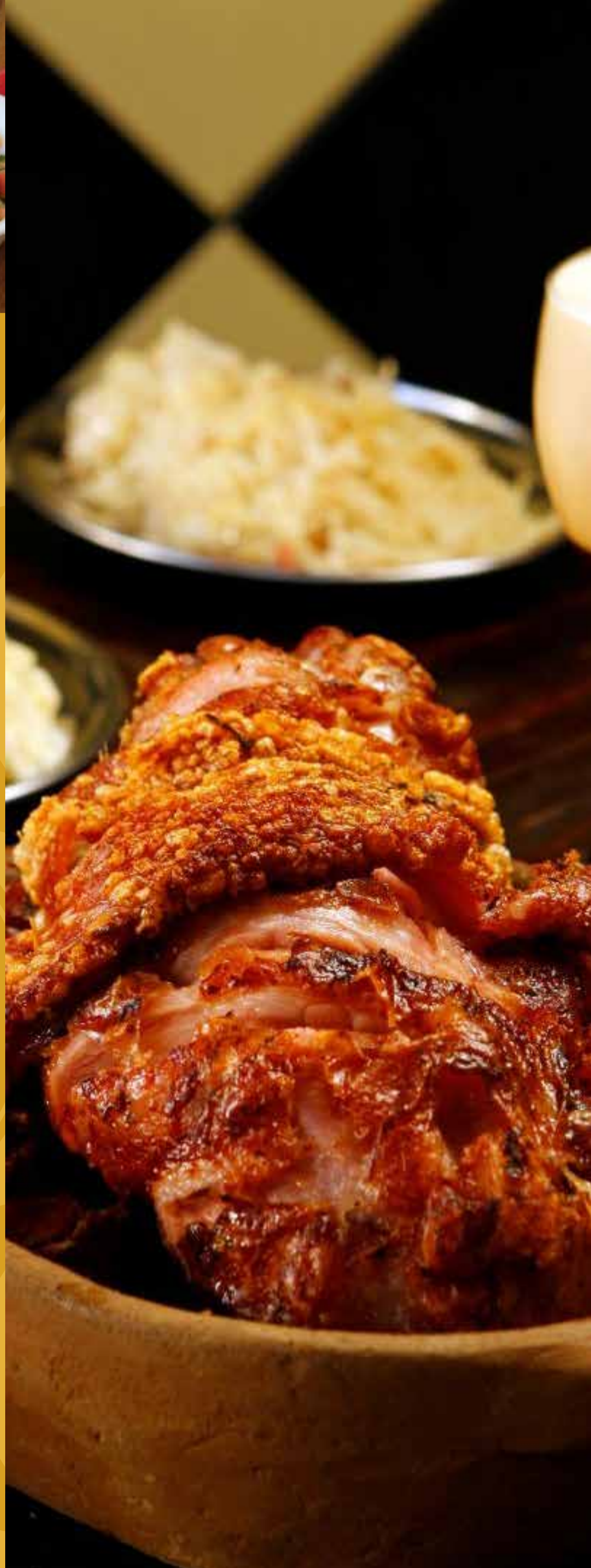
Schweinshaxe (Joelho de porco à pururuca)

Enchendo Linguiça 19,00 Sanduíche de linguiça, catupiry e alho poró Enchendo Linguiça Simples 15,00 Pão com linguiça Chique 25,00 Sanduíche de filé mignon, frango ou pernil suíno com queijo mussarela e abacaxi Botequim 16,00 Sanduíche de carne assada Boteco 16,00 Sanduíche de pernil suíno Joelito 19,00 Sanduíche de iscas de Joelho de porco acebolado